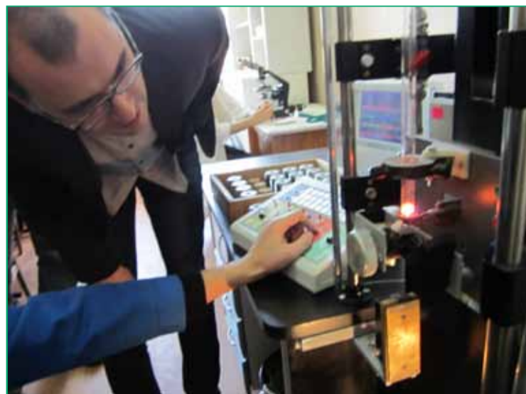
Am Forschungsinstitut ELIRI erhalten Wissenschaftler des Max-Planck-Instituts Heidelberg Einblick in die Herstellung von Nanodrähten.

Die Oberflächenladung-Lithographie erwies sich als effizient für zweidimensionale und