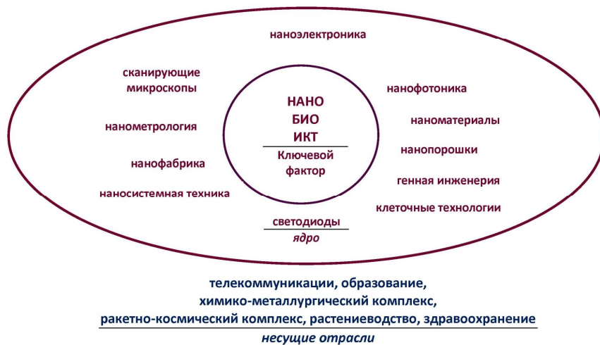
Рисунок 1. Структура нового (VI) технологического уклада.

авиа-, судо-, автомобиле-, приборо-, станкостроение, солнечная энергетика, электроника, электротехника атомная промышленность, ядерная энергетика