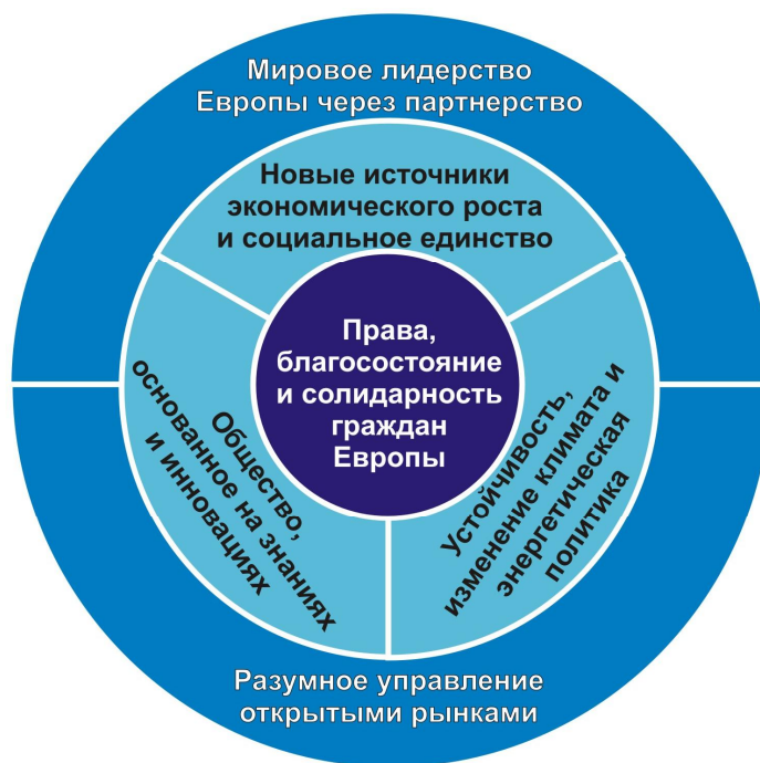
Рисунок 2. Схема общества, предложенная Председателем Европейской Комиссии Жозе Мануэлем Баррозо.

Как видно из рис.2, общество, основанное на знаниях и инновациях является основным элементом дальнейшего развития Европы,